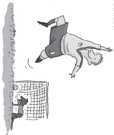
Abb.: © Philip Waechter

Die Rivalität im Fußball zwischen den Anhängern von Hannover 96 und Eintracht Braunschweig ist auch heutzutage für diejenigen offensichtlich, die sich gar nicht für Fußball interessieren. Doch woher stammt diese ausgeprägte Feindschaft? Sebastian Kurbach, ehemals Leiter des 96-Archivs, nimmt Sie mit auf eine spannende Zeitreise.