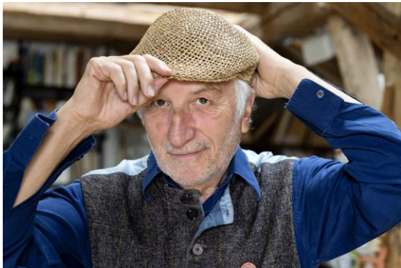
Abb. 1: Peter Gaymann

Diese Bilder stehen Ihnen auf unserem Presse-Portal zum Download zur Verfügung und können im Rahmen der Berichterstattung über die Ausstellung kostenfrei genutzt werden: www.karikatur-museum.de/presse (Passwort: Karikatur+Zeichenkunst).