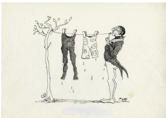
Abb. 5: Cartoon: »Wäschleinen-Lämpel« aus dem Buch Gaymanns Lämpeleien (Collagierte Zeichnungen zu Lehrer Lämpel von Wilhelm Busch), 1980 © Peter Gaymann