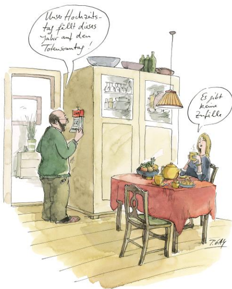
Abb. 7: Cartoon: »Unser Hochzeitstag fällt in diesem Jahr ...« aus der Reihe »Paar Probleme« © Peter Gaymann