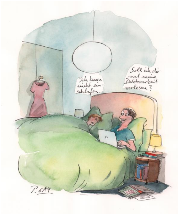
Abb. 6: Cartoon: »Ich kann nicht einschlafen« aus der Reihe »Paar Probleme« © Peter Gaymann