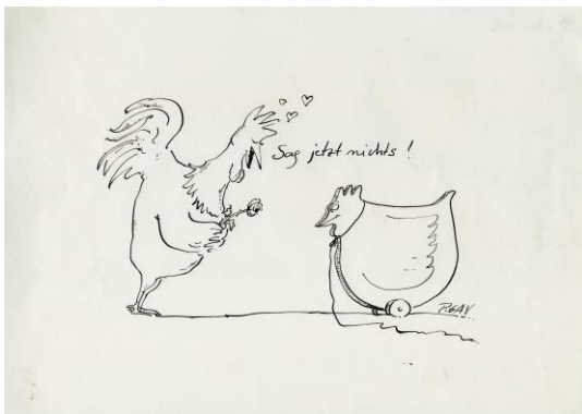
Abb. 4: Cartoon: »Sag jetzt nichts« aus dem Buch Huhnstage, 1983 © Peter Gaymann